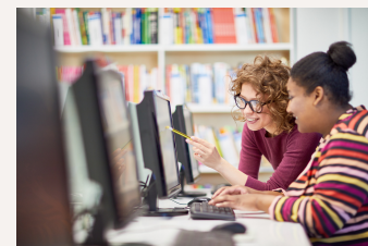
Atelier numérique au Hall de numérique de la ligue de l'enseignement